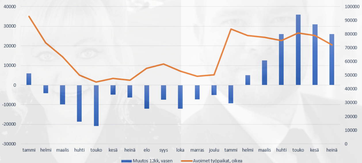
Avoimet työpaikat 2020-21 ja muutos 12 kk

Avointen työpaikkojen määrässä näkyy sekä kausivaihtelut että pandemian aiheuttamat muutokset sekä Q2:sta alkanut työmarkkinoiden avautuminen